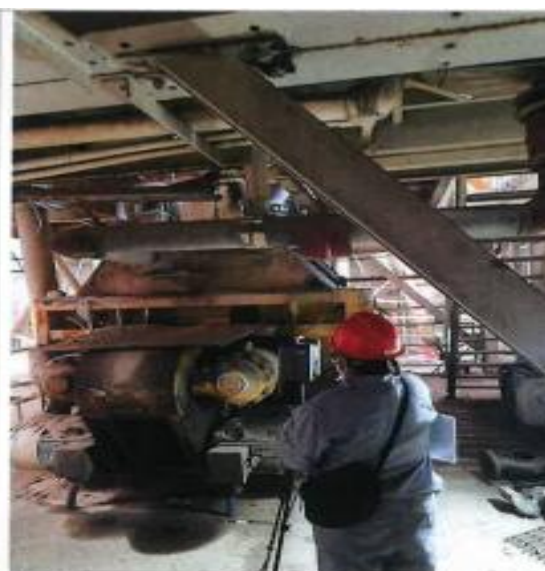
2025.8.11 搅拌机 粉尘采样